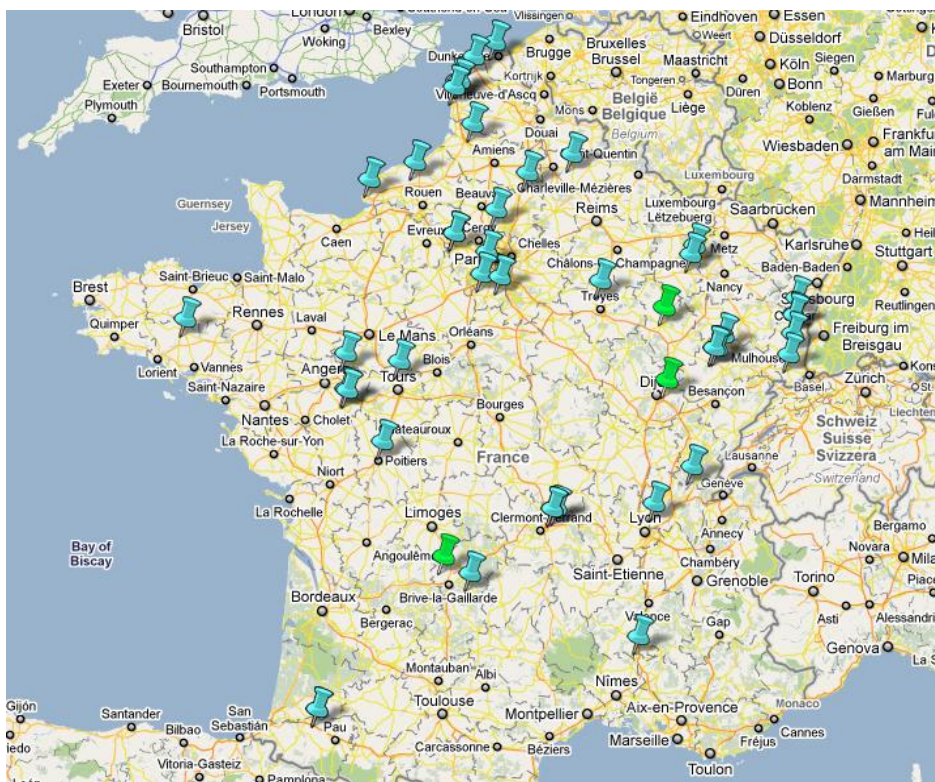
Figure 1 : l'étendue nationale du réseau ACF

Retrouver les implantations locales du réseau Agriculteurs Composteurs de France, avec les coordonnées des plateformes par département :